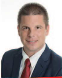
Erich Hess Nationalrat Bern